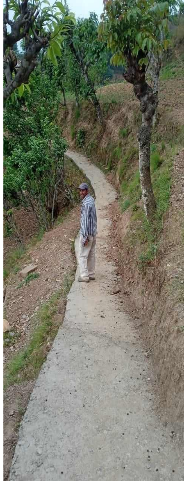
रिहिराम गोरेटो बाटो