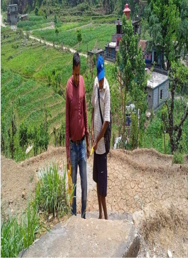
किटिया बसन्तडाँडा गोरेटो बाटो