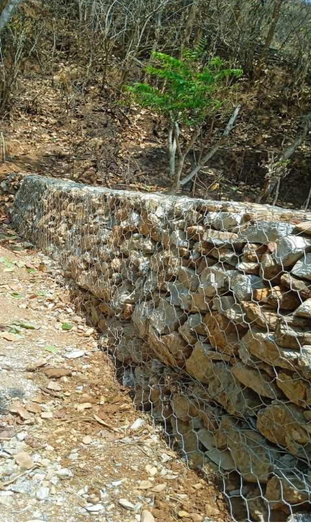
वैसेनी गैह्वा मुल व्यवस्थापन