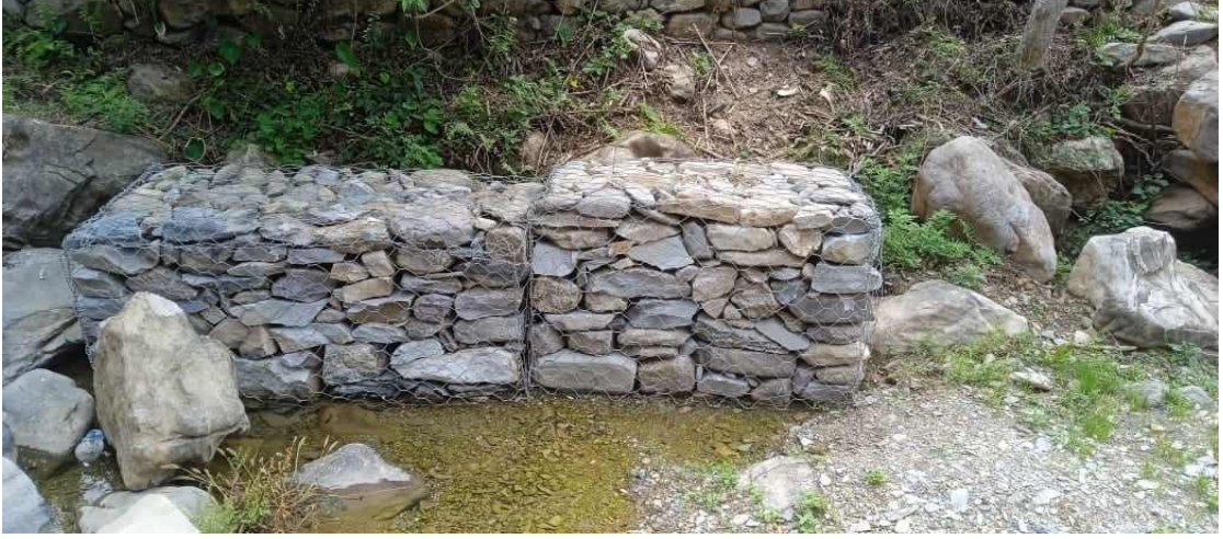
रिकाट तार जाली व्यवस्थापन