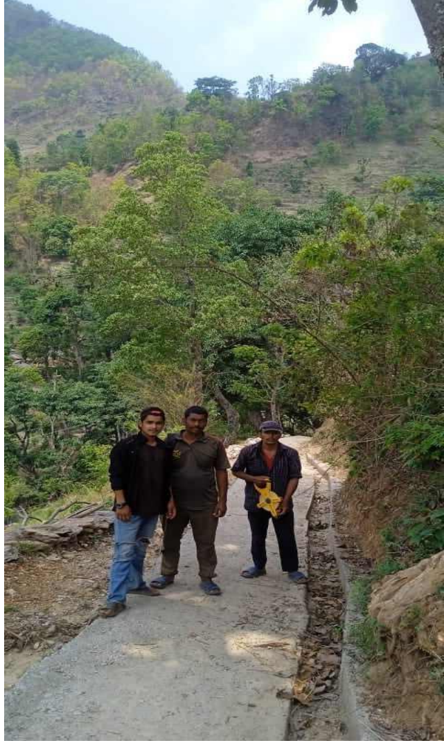
देउराली फल्थोक आग्रीडाँडा गोरेटो