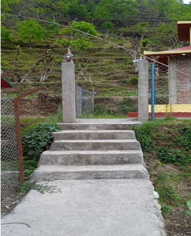
कालासारु कुल थान